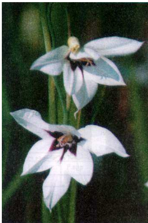
Fot. 1. Kwiaty Acidanthera bicolor Phot. 1. Flowers of Acidanthera bicolor