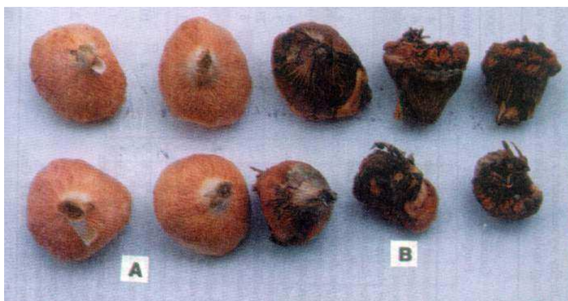
Fot. 2. Bulwy Acidanthera bicolor : A – zdrowe, B – chore Phot. 2. Corms of Acidanthera bicolor : A – healthy, B – diseased